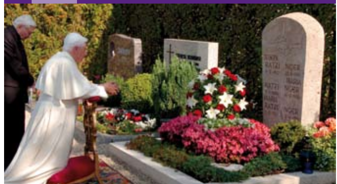
Papst Benedikt XVI. und sein Bruder Georg Ratzinger (I) beten am Grab ihrer Eltern und ihrer Schwester auf dem Ziegtsdorfer Friedhof in Regensburg.