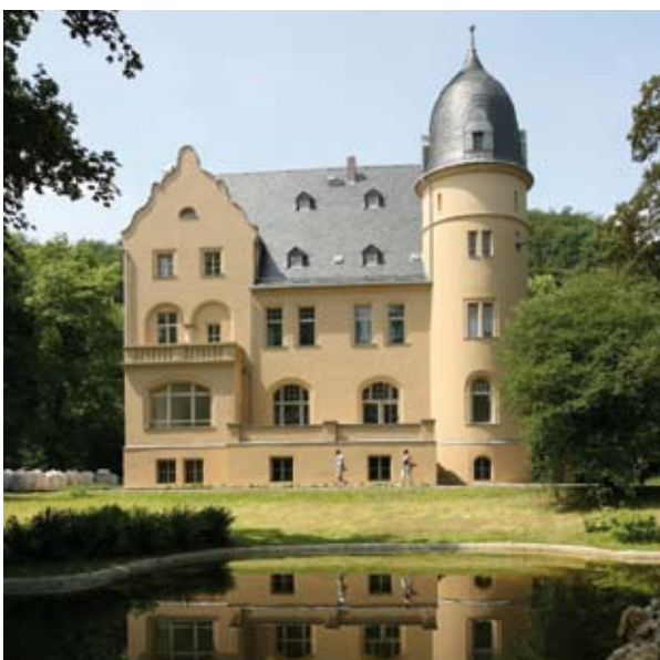
Im Park der Fabrikanten Villa „Jahr“ zeigen Friedhofsgärtner und Steinmetze bei der BUGA 2007 ihr Leistungsspektrum auf.

In der Villa selbst erwartet die Gartenschaubesucher eine Ausstellung zur Bestattungs- und Friedhofskultur. Gepflegt werden die Gräber während der Zeit der BUGA von angehenden Friedhofsgärtnern aus ganz Deutschland. Sie stellen sich den Fragen der Besucher und sammeln auf diese Art und Weise wichtige Erfahrungen.