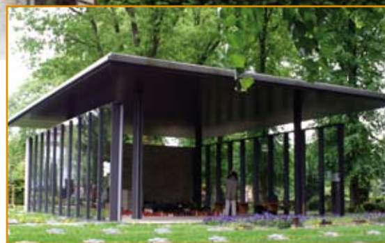
Das Grab der „Barmherzigen Schwester“ Maria Euthymia hat sich zu einem Wallfahrtsort entwickelt. Viele Menschen die hier beten, suchen Trost und bitten um Heilung ihrer Krankheit.

Der Zentralfriedhof in Münster ist nicht nur ein Ort des Gedenkens und der Andacht. Mit seinem alten und gut gepflegten Baumbestand sowie seinen ausgedehnten Grünflächen ist er als grüne Oase mitten in der Großstadt für viele Menschen ein Refugium im Alltagsstress. Zudem lädt er mit seinen zahlreichen Denkmälern zu einer spannenden Entdeckungsreise durch deutsche Geschichte ein.